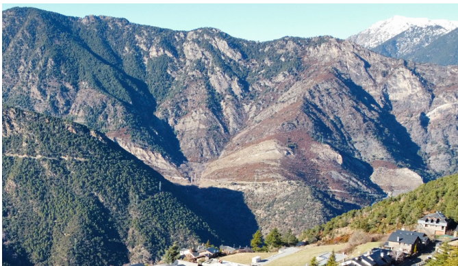
Habitatge unifamiliar amb jardí, 4 habitacions, 3 banys, ampla terrassa, garatge interior i dos places d'aparcament exterior.